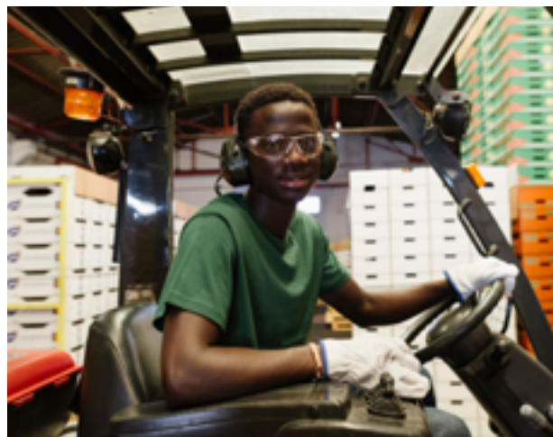
Imagen de la empresa Klingele Embalajes Canarias, que ha contado con el apoyo de COFIDES para su crecimiento en Mauritania

18,06 millones de euros en 29 operaciones en 12 países