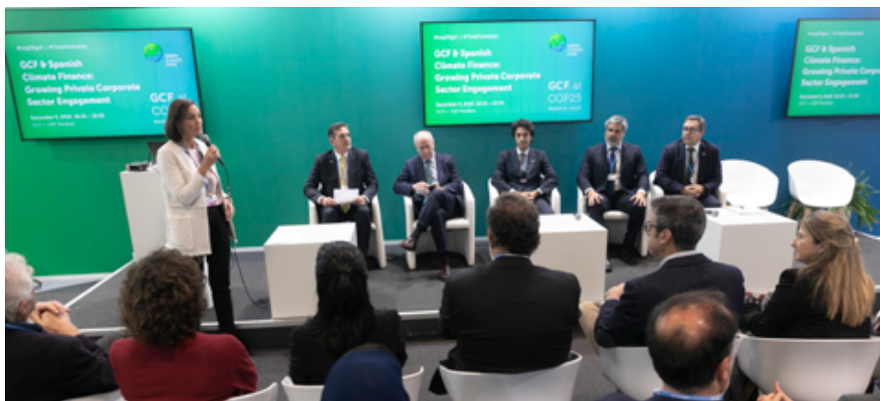
Participantes en el panel organizado por el Fondo Verde para el Clima de Naciones Unidas y COFIDES durante la COP25

En 2019 COFIDES ha estado trabajando en la identificación de potenciales proyectos, en particular a través del lanzamiento de una convocatoria de propuestas.