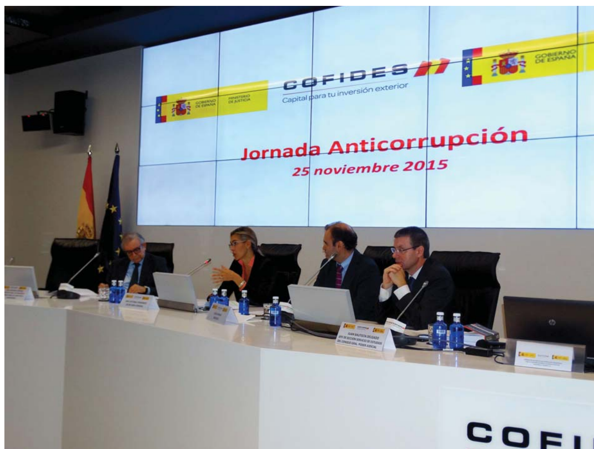
Jornada formativa en materia anticorrupción

Hasta la fecha no se han detectado casos de corrupción, por lo que no ha sido precisa la adopción de las medias previstas en el procedimiento operativo.